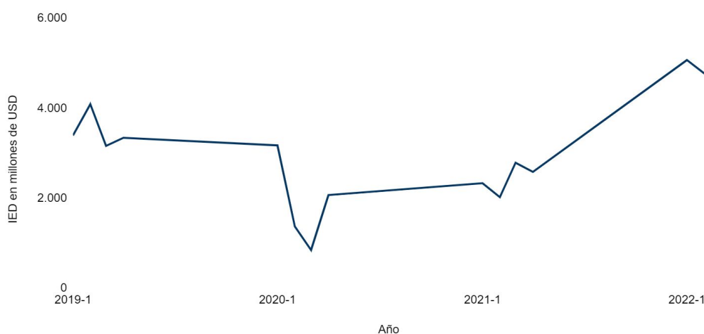
Inversión extranjera directa en Colombia 2019,Q1 - 2022-Q2