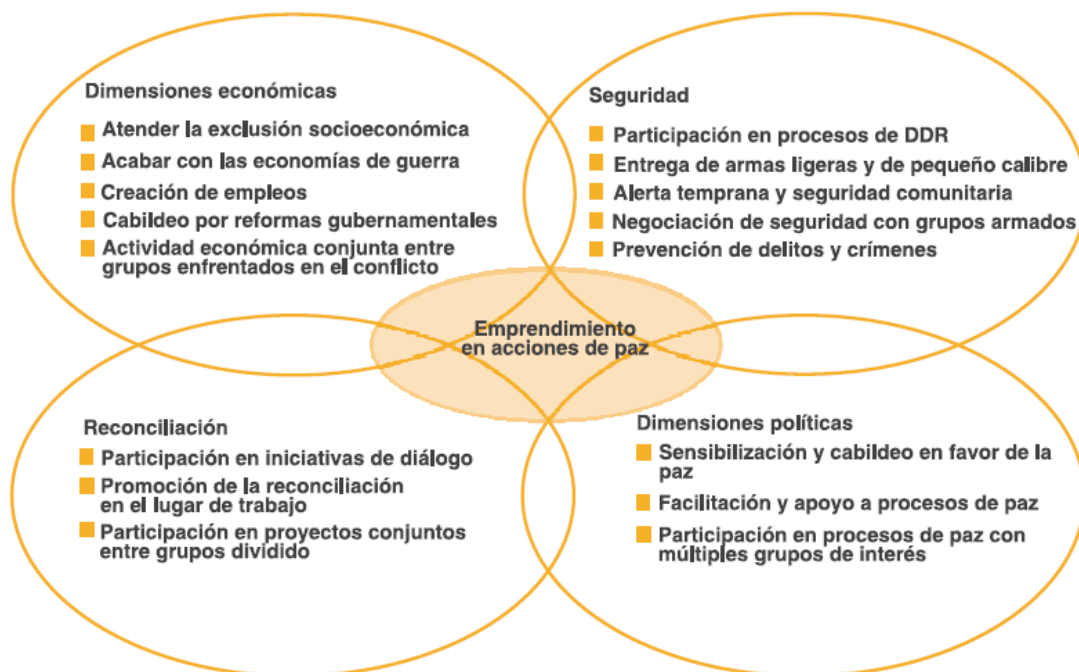
Figura 2. Emprendimiento en acciones de paz.