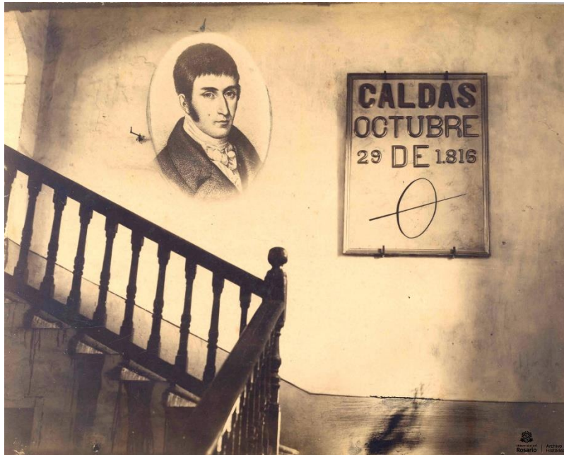
Fotografía de la escalera principal del Claustro de la Universidad del Rosario tomada a finales del siglo XIX en la que se observa la placa y retrato de Francisco José de Caldas. Colección Archivo Histórico de la Universidad (Alb. 01, foto 031).

Caldas fue inventor del hipsómetro, un instrumento con el que se podían medir las alturas a través de la relación entre la presión atmosférica y el punto de ebullición de los líquidos, fue un expedicionario estudioso de la naturaleza y encargado por José Celestino Mutis del Observatorio Astronómico un punto de encuentro para quienes lideraron los procesos independentistas.