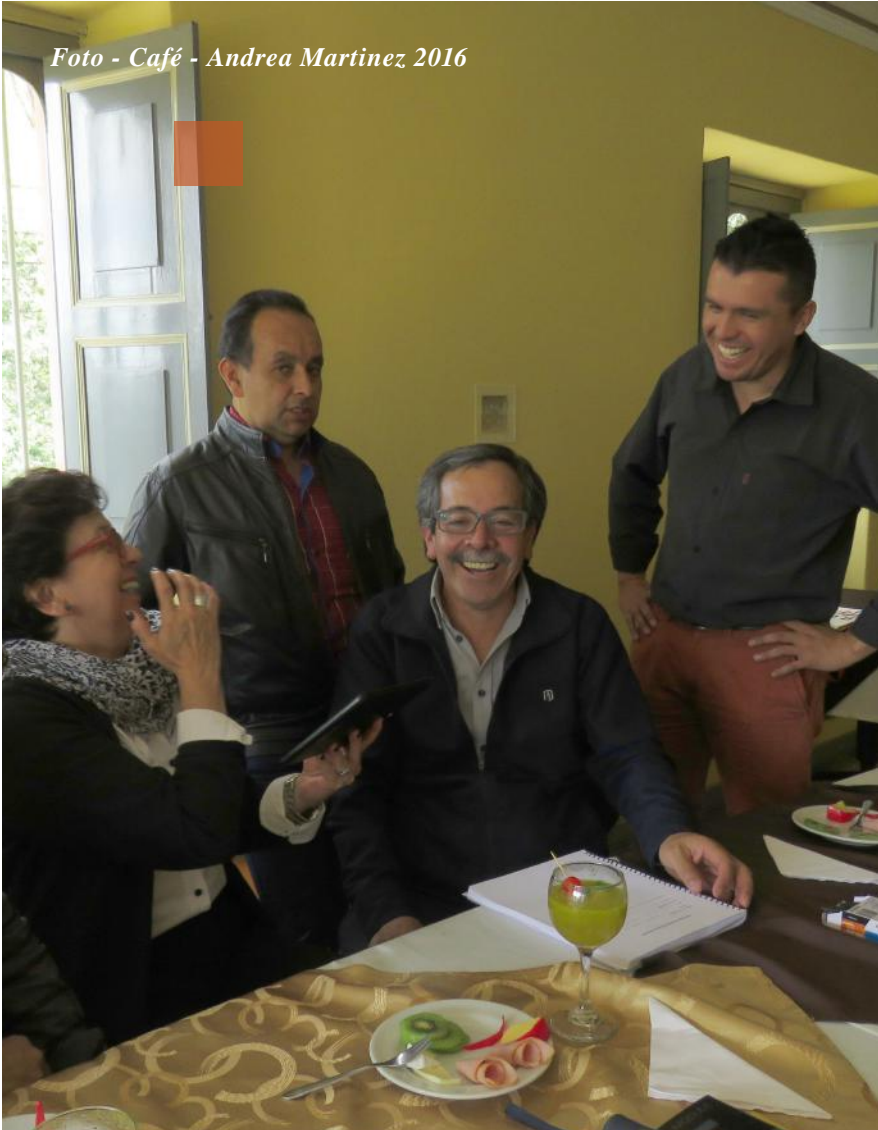
FOTO - CAFÉ

Tertulias fotográficas a las que inicialmente se invitaron trabajadores con más de treinta y cinco años en la Universidad. Se considera un espacio para compartir, recordar y especialmente hacer un aporte a la memoria de la Universidad, a través de la descripción de fotografías; la metodología para esta actividad consiste en organizar álbumes con fotografías seleccionadas por categorías y entregarlas a los grupos previamente conformados, el álbum incluye la fotografía codificada y los campos de descripción básica (personajes, fecha, contexto, entre otros)