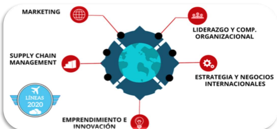
Figura 1. Líneas de Investigación Escuela de Administración 2020

En consecuencia, de lo anterior, durante el primer semestre de 2020 se definió un nuevo sistema de investigación con cinco líneas de investigación y sus respectivos directores, tal como se ilustra en las Figuras 1 y 3.