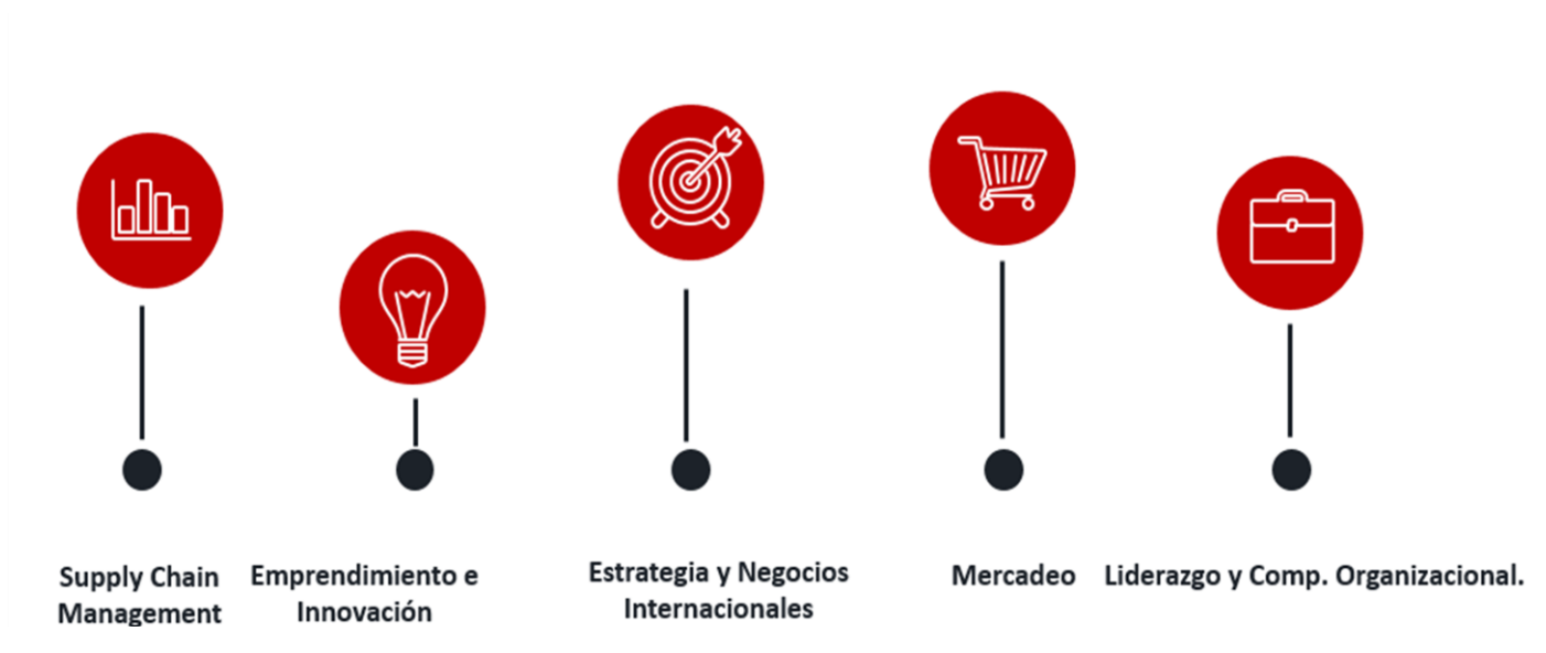
Figura 3. Líneas Investigación Escuela de Administración 2021